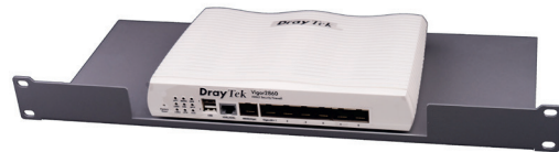
Einfache, aber clevere Lösung – optimale Belüftung durch die Öffnung im Halterungsblech